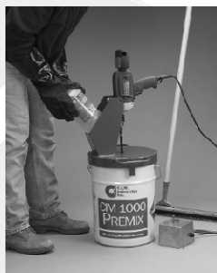
Rys. 1 Pokrywa z urządzeniem mocującym wiertarkę napędzającą mieszadło